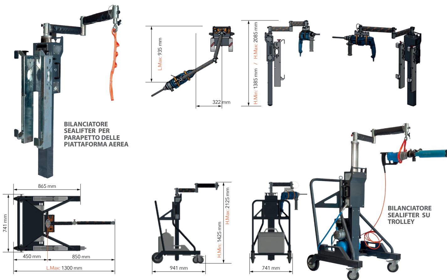
BILANCIATORE SEALIFTER PER PARAPETTO DELLE PIATTAFORMA AEREA

Il sistema prevede una staffa multi posizione dotata di due cinghie di fissaggio e progettata per bilanciare il baricentro ideale dell'utensile, consentendo anche operazioni lunghe e ripetitive, precise e sicure, senza sforzi.